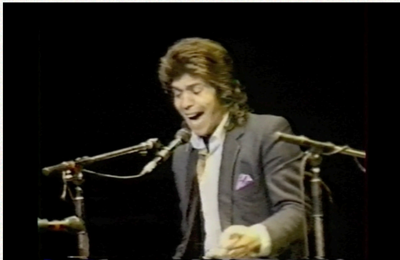
Camarón de la Isla